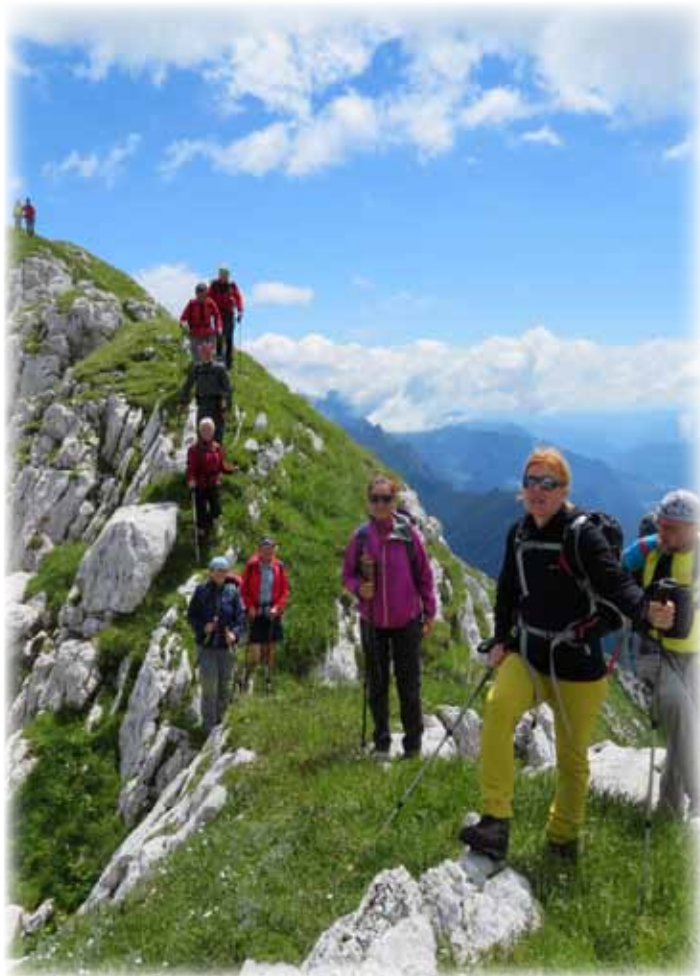
Na eni izmed mnogih tur v organizaciji VO PD Kamnik.