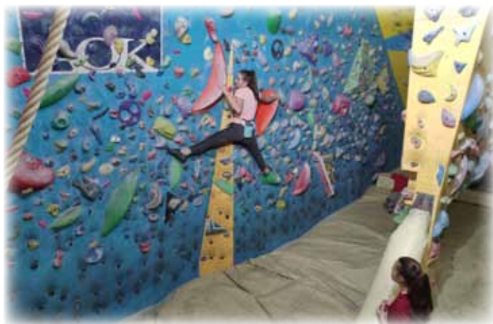
Trening mladine na plezalni steni.

https://prosticass.si trgovina: Kamnik, Šutna 37